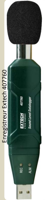
Enregistreur Extech 407760

Dans l'habitat ou sur la place de travail, les bruits extérieurs proviennent jusqu'aux occupants car l'intensité est trop élevée ou parce que l'isolation du bâtiment est trop faible.